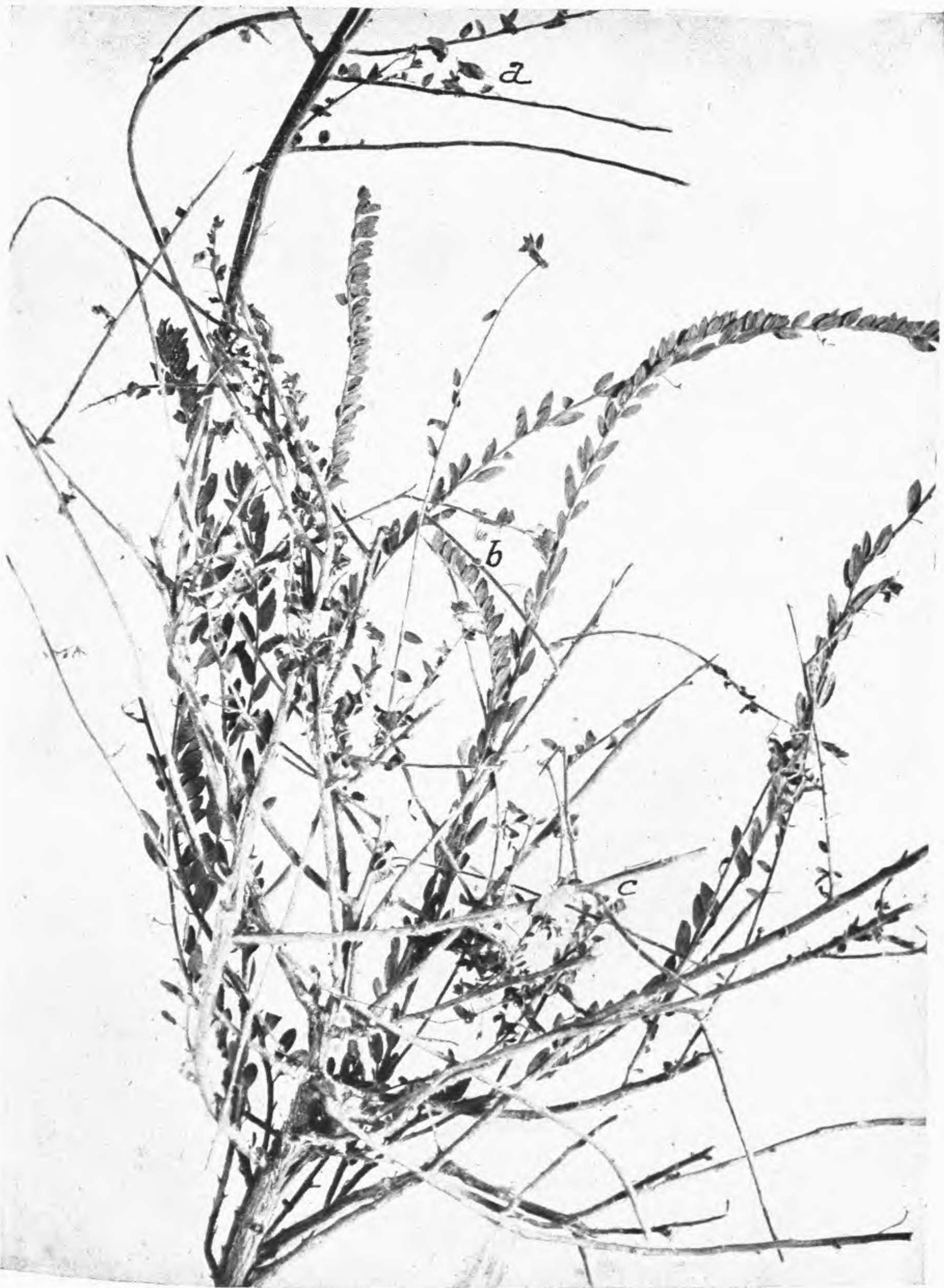
Linaria micromerioides Batt. et Trab.